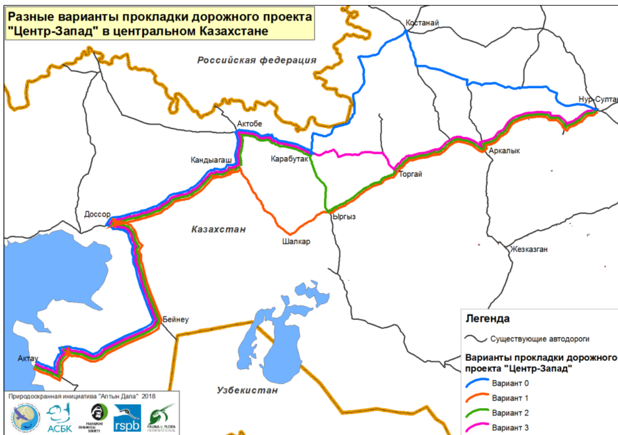
Рисунок 1: Картосхема разных вариантов прокладки дороги от Нур-Султана до Актау.