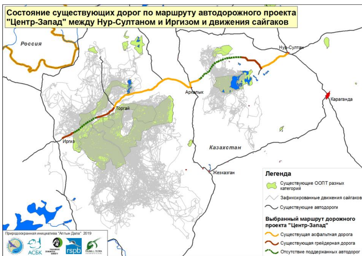
Рисунок 2: Состояние дорог по планируемому маршруту дорожного проекта Центр-Запад между Нур-Султаном и Иргизом и пути движения сайгаков бетпакдалинской популяции.

Из общедоступных материалов следует, что участок дороги между г. Нур-Султан и с. Шалкар пройдет совсем рядом с территорией Иргиз-Тургайского государственного природного резервата, Государственного природного резервата «Алтын Дала» и Экологического коридора «Ыргыз-Тургай-Жыланшык», которые играют важную роль в сохранении бетпакдалинской популяции сайги (см. рис. 2). Данные факты почти не учитывались в отчете ОВОС. Кроме того, планируемая дорога пересекает Тургайский государственный природный заказник, который с его системами озёр в низовьях рек Иргиз и Тургай является водно-болотным угодьем международного значения, включенным в список Рамсарской конвенции, а также ключевой орнитологической территорией. Пересечение данной территории вообще не было учтено в процессе планирования трассы и ОВОС. Эти факты показывают серьезные упущения в процессе разработки необходимых для планирования дороги документов, что является нарушением законов РК.