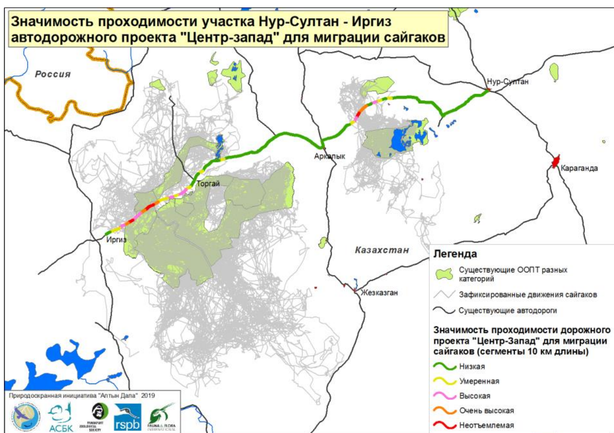
Рисунок 3: Значимость сегментов дорожного проекта Центр-Запад (по 10-км отрезкам) для пересечения сайгаками в ходе их миграции.

Данные спутникового слежения сайгаков, собранные АСБК с 2009 года, четко показывают, что не менее 370 км запланированной трассы прокладки дороги, что равно 36,5% участка между Нур-Султаном и Шалкарком, постоянно и в большом числе пересекаются сайгаками во время миграции (рис. 3). Также весьма вероятно, что территория, используемая сайгаками для миграции, будет увеличиваться, поскольку популяция находится в фазе активного роста. На рисунке 2 хорошо видно, что сайгаки во время миграции стараются избежать пересечения существующей асфальтированной дороги и даже грейдера, и что поток миграций сужается в районе, где отсутствует обслуживание дорог. Планируемая дорога также отделит летние пастбища сайгаков к северу от остальной части ареала вида; сайгаки обычно мигрируют более чем на 250 км к северу от запланированной прокладки дороги.